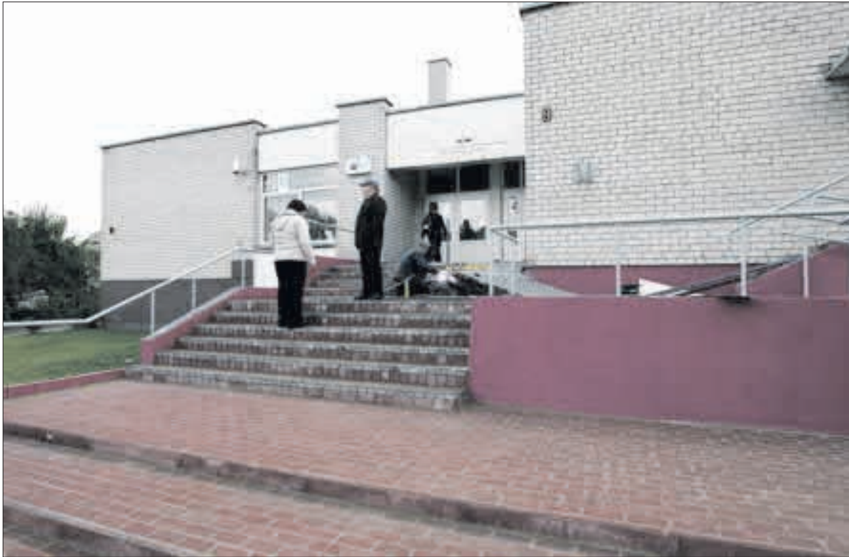
Viešajai įstaigai Tirkšlių pirminės sveikatos priežiūros centrui tapus „uabu“, tikimasi didesnės ekonominės naudos.