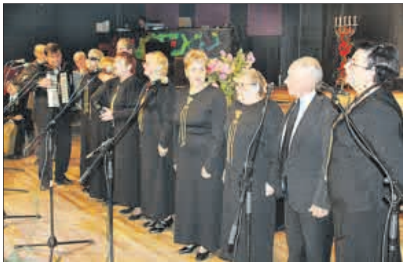
Dainuoja LASS Mažeikių filialo ansamblis „Žemaitelė“.