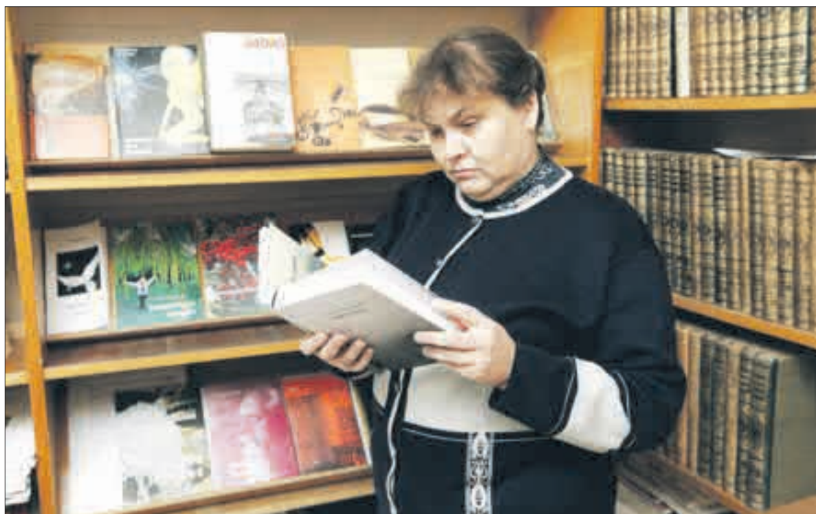
Mažiekiškųjų išleistų knygų galima rasti ir Savivaldybės viešojoje bibliotekoje.