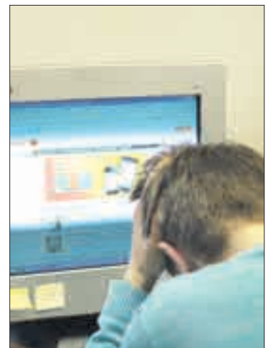
Pareigūnai ragina gyventojus niekam neatskleisti savo internetinės bankininkystės prisijungimo kodų.