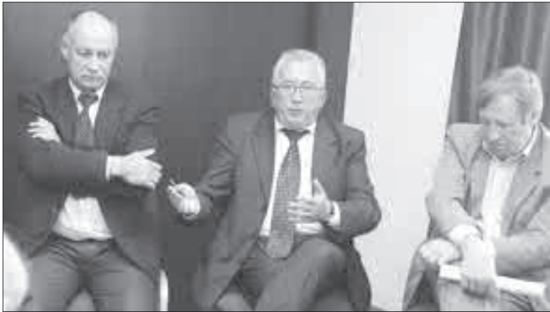
Į susitikimą meras pasikvietė ir Mažeikių butų ūkio bei Šilumos tinklų atstovus.