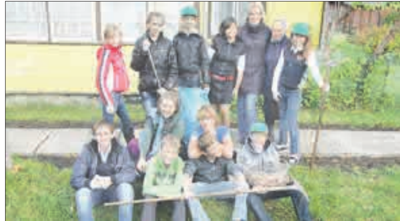
Baigus darbus ir vaikams iš Senamiesčio mokyklos, ir jų vadovei bei senajai šių namų šeimininkei buvo smagu pabūti kartu ir atskivėpti.