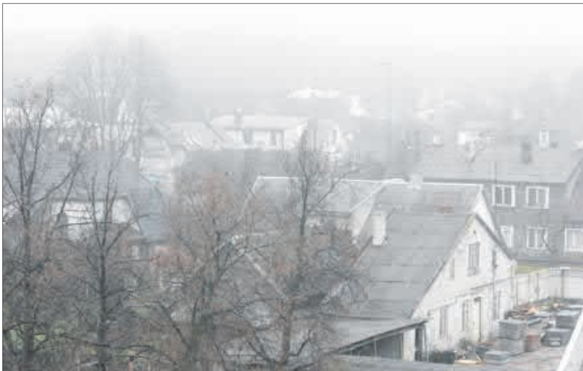
Kiek rajone asbestinio šiferio stogų, kol kas tikslios informacijos nėra.