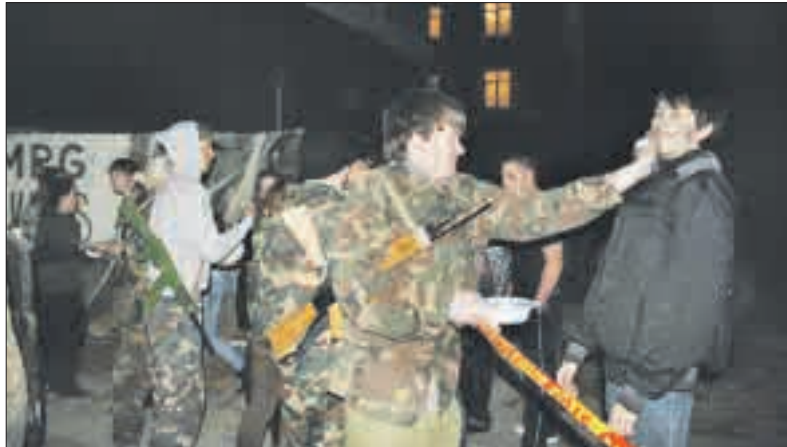
Merkelio Račkausko gimnazijos pirmaklasiai atlaikė senbuvų „kariškių“ parengtus išbandymus.

Juk krikštynos tam ir yra, kad galėtume draugiškai priimti naujokus į savo bendruomenę.