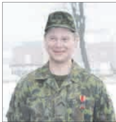
S. Sudintas savanorių tarnyboje jau dvylika metų.

Vyriausias, jau 15-us metus savanoriškoje krašto apsaugoje tarnaujantis