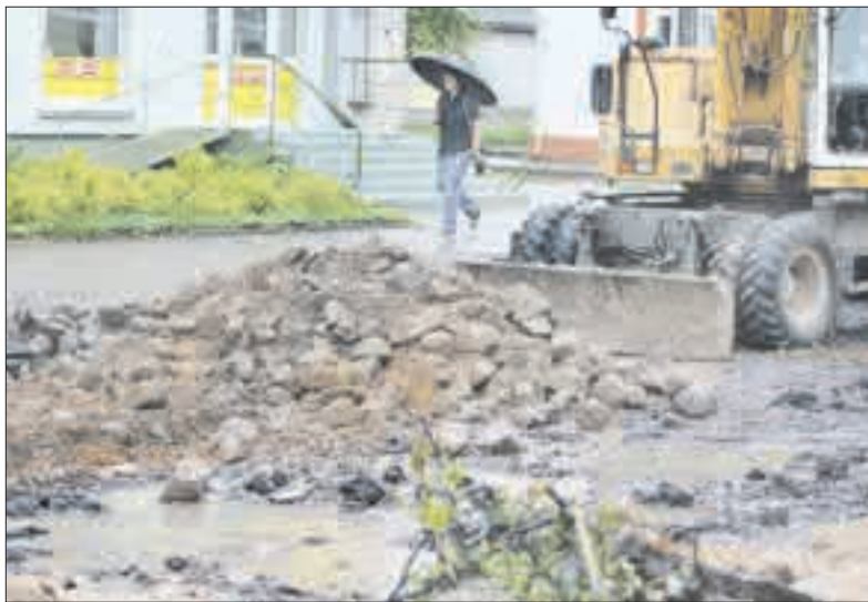
Kur šiuo metu laikomi Laisvės gatvėje atkasti akmenys – specialistai „Santarvei“ pasakyti negalėjo.

„Ko gero, ją sutvarkė rangovas, kaip gali tvarkyti tokius dalykus: ar sumalė, ar kažkur sandėliuoja – nežinau. Tai jau yra rangovo turtas, o mes jį nesikėsiname. Jeigu atkasė ką nors gero, mes negalime sakyti, kad mums atiduotų. O, geras žvyras, atiduokite mums, atkasėte akmenį – o, atiduokite mums, atkasėte kokį metalo gabalą – mums taip pat jo reikia,“ – situaciją aiškino vedėjas ir pridūrė, kad rangovams buvo nu-