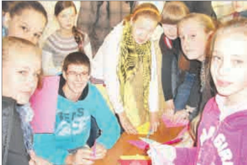
Sodų vidurinės mokyklos mokiniai – Tolerancijos dienos dalyviai.