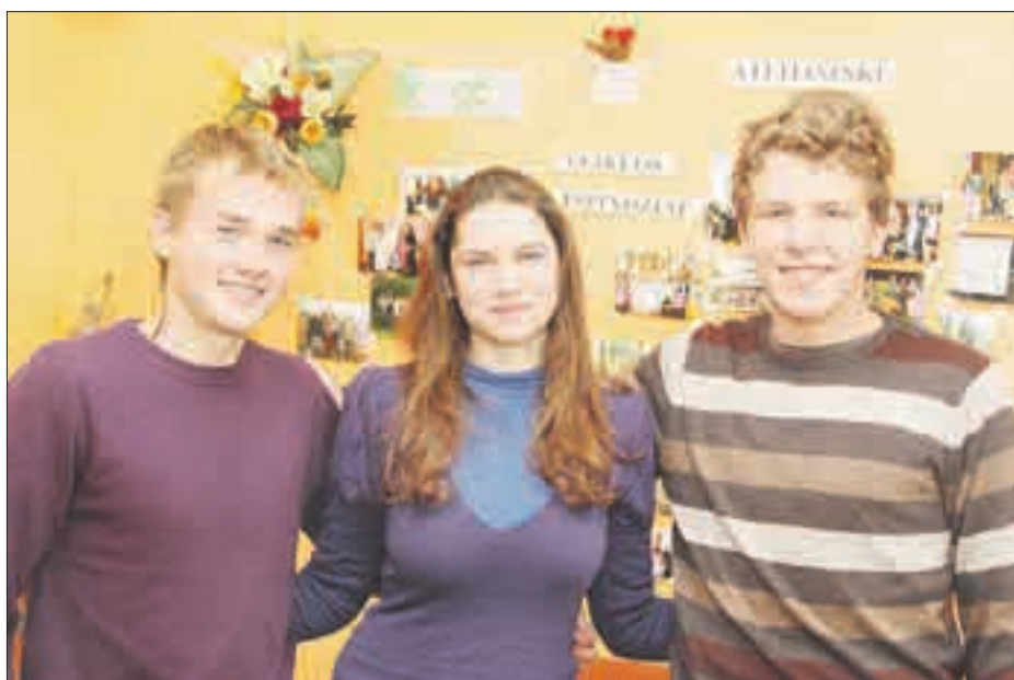
Ateitininkai iš Pikelių teigė: Rudens akademijoje įsimintiniausias buvo bendravimas ir įvairūs konkursai, vakaronės.

gali ne bet kas, visų pirma širdelėse turi degti meilė Tėvynei ir Dievui“, – paaiškino V. Mažonienė. Ateitininkų kuopa Pikeliuose susikūrė prieš penkerius metus.