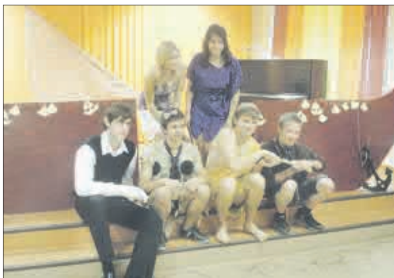
Židikiškiai tą dieną susirinko į įdomų renginį.