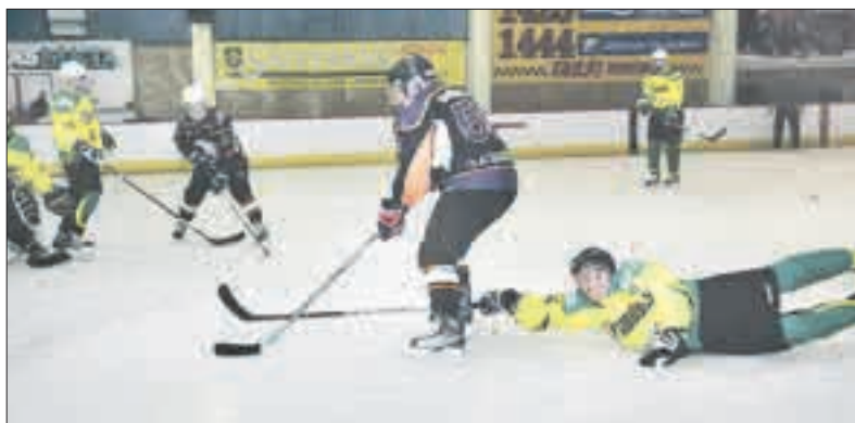
„Smūgio“ (geltona apranga) ledo ritulininkai kovojo negailėdami nei varžovų, nei savęs.

Vidas STANKUS vidas@santarve.lt Tel. 98269