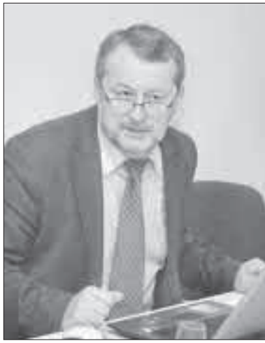
A. Grumadas patikino, kad svarstoma, kaip sutaupyti lėšas perduoti į tuos sektorius, kur jų trūksta.

Investicinius būsto renovavimo projektus rengė patys butų savininkai. Dažniausiai jie samdėsi įmones, kurios atliko skaičiavimus.