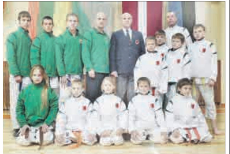
Mažeikiškių delegacija iš Latvijos grįžo su penkiais medaliais.