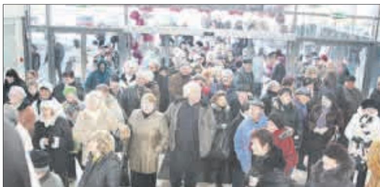
Pirmieji prekybos centro lankytojai bemat užplūdo parduotuves...

Bendras visų prekybos salių plotas – 5 tūkst. kvadratinį metrų, naujajame prekybos centre sukurta apie 100 darbo vietų.