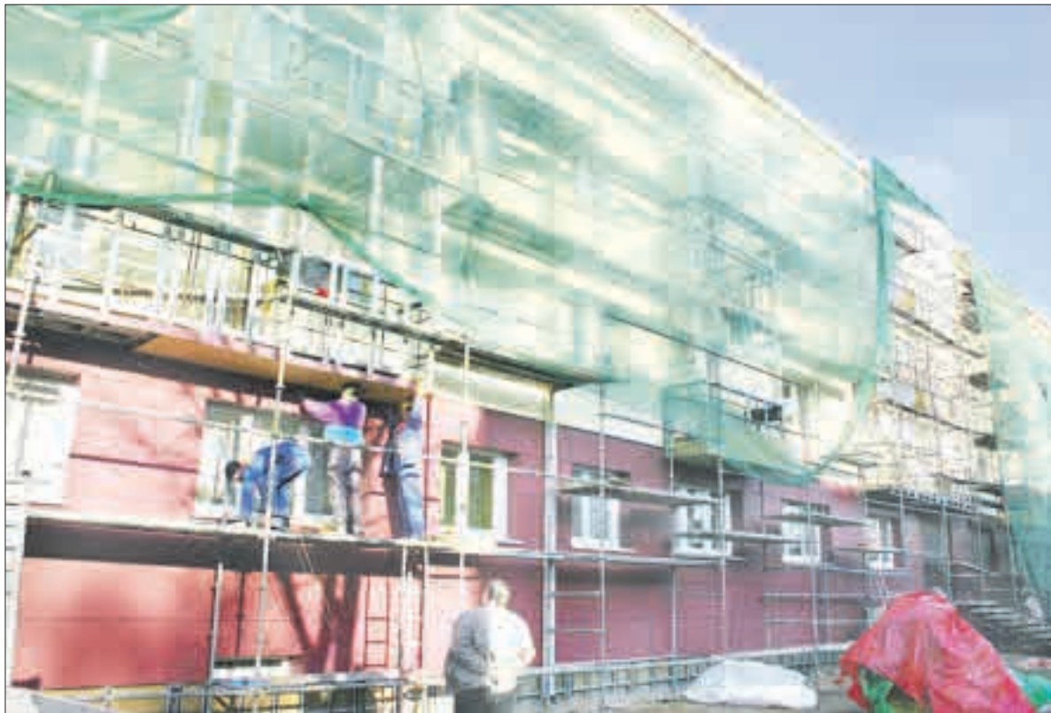
Daugeliui dabar renovuojamų namų trūksta lėšų darbams užbaigti.