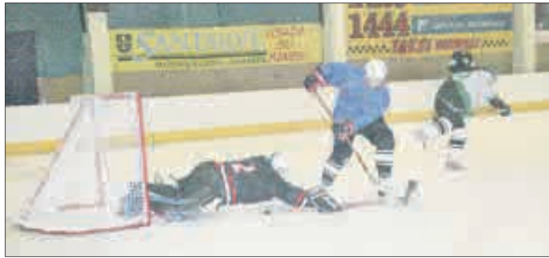
Ledo arenoje turėtų treniruotis Mažeikių, Plungės ir Telšių vaikai.

maityja turės šioje mokykloje išugdytą ledo ritulio komandą.