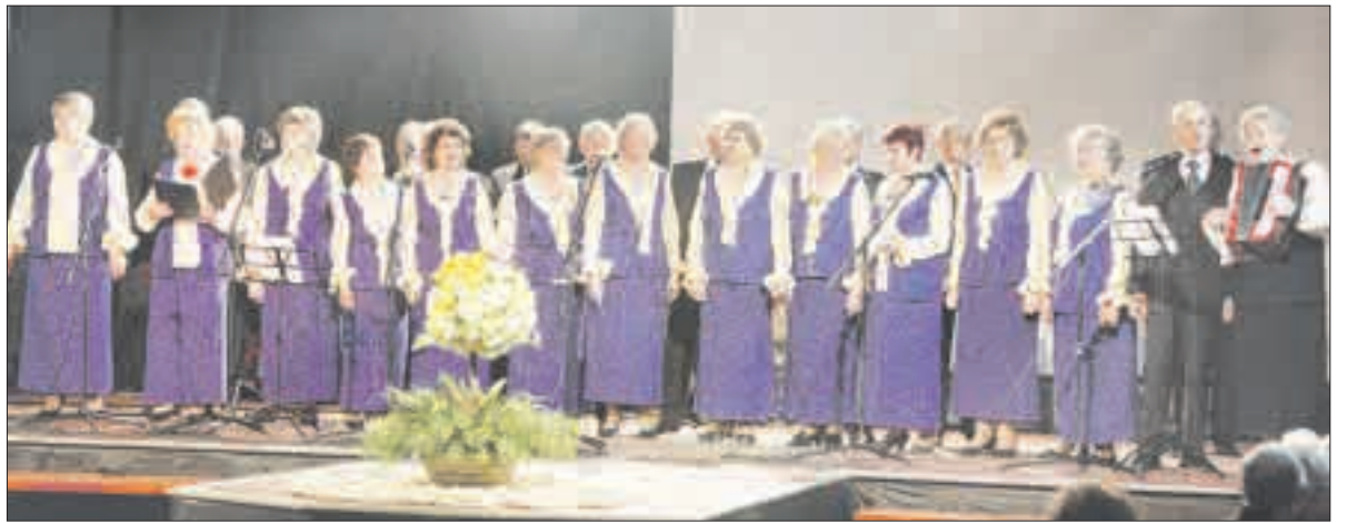
Pabūti kartu „Bočiai“ sukvieta įvairių kolektyvų atstovus.

Daugiau kaip du šimtai senjorų ketvirtadienį susirinko į vakaronę „Bendraukime kartu“. Šventę organizavusių „Bočių“ aktyvistų teigimu, tokie renginiai stiprina draugystę.