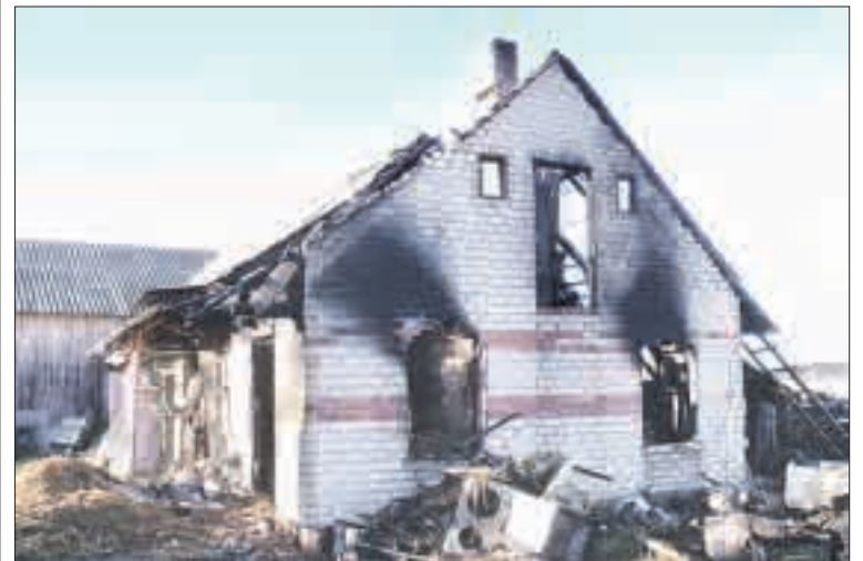
Pergaisrą išdegė patalpos vidus, nudegė dalis stogo.