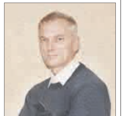
tadienio pavakarę viešbučio „Astrium Palace“ restorane.

Su keliautojo istorijomis mažeiškiai gali susipažinti ketvir-