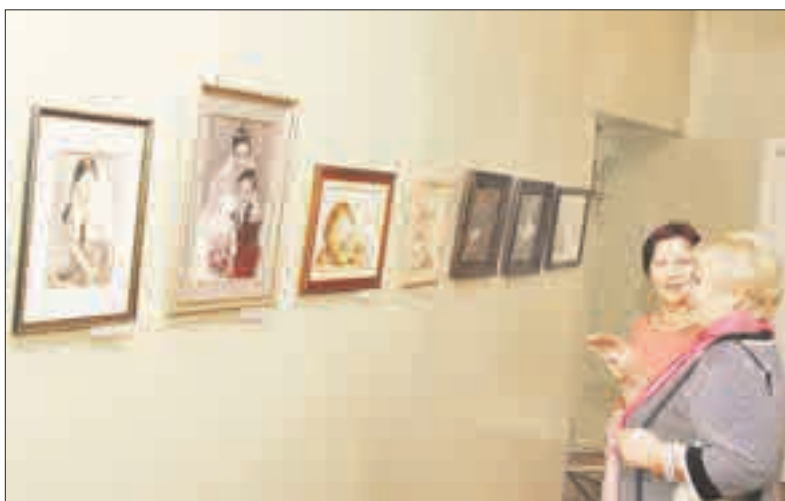
Parodoje pateikti šešiolikos autorių darbai.

Paroda bus eksponuojama visą lapkričio mėnesį. Janina SRIBALIUTĖ