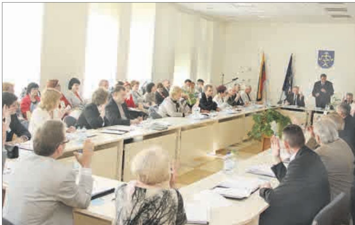
Kompensuoti išlaidas, susijusias su darbu Savivaldybės taryboje, kol kas paprašė tik trečdalis jos narių.

jiems „buhalterinė apskaita“ per didelis vargas, dėl to ir nusispjovė į pinigus.