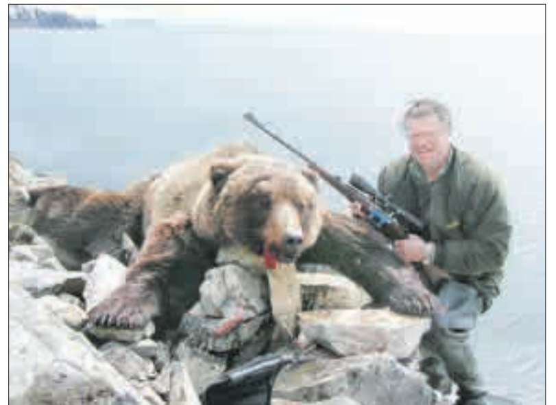
Šio dviejų metrų laimikio iškamša dabar puošia medžiotojo namus.

Praėjo kažkiek laiko, ir Edmundas tas pačias moteris pamatė sker-