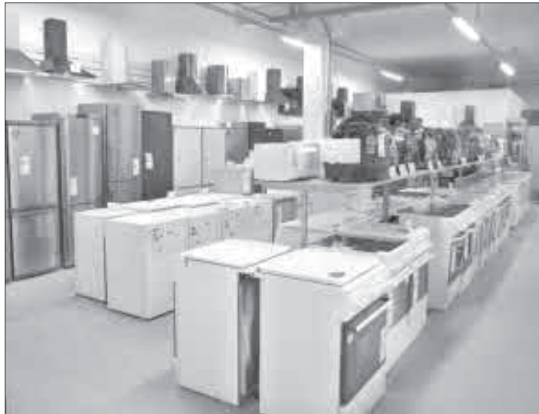
Parduotuvė „NAMŲ ERA“ jau pasiruošusi priimti klientus.

vičius pažymi, kad ne tik kainų lankstumu ir prekių asortimentu gausa vilios savo lankytojus: klientus pasitiks kvalifikuoti darbuotojai, kurie suteiks visą reikiamą informaciją.