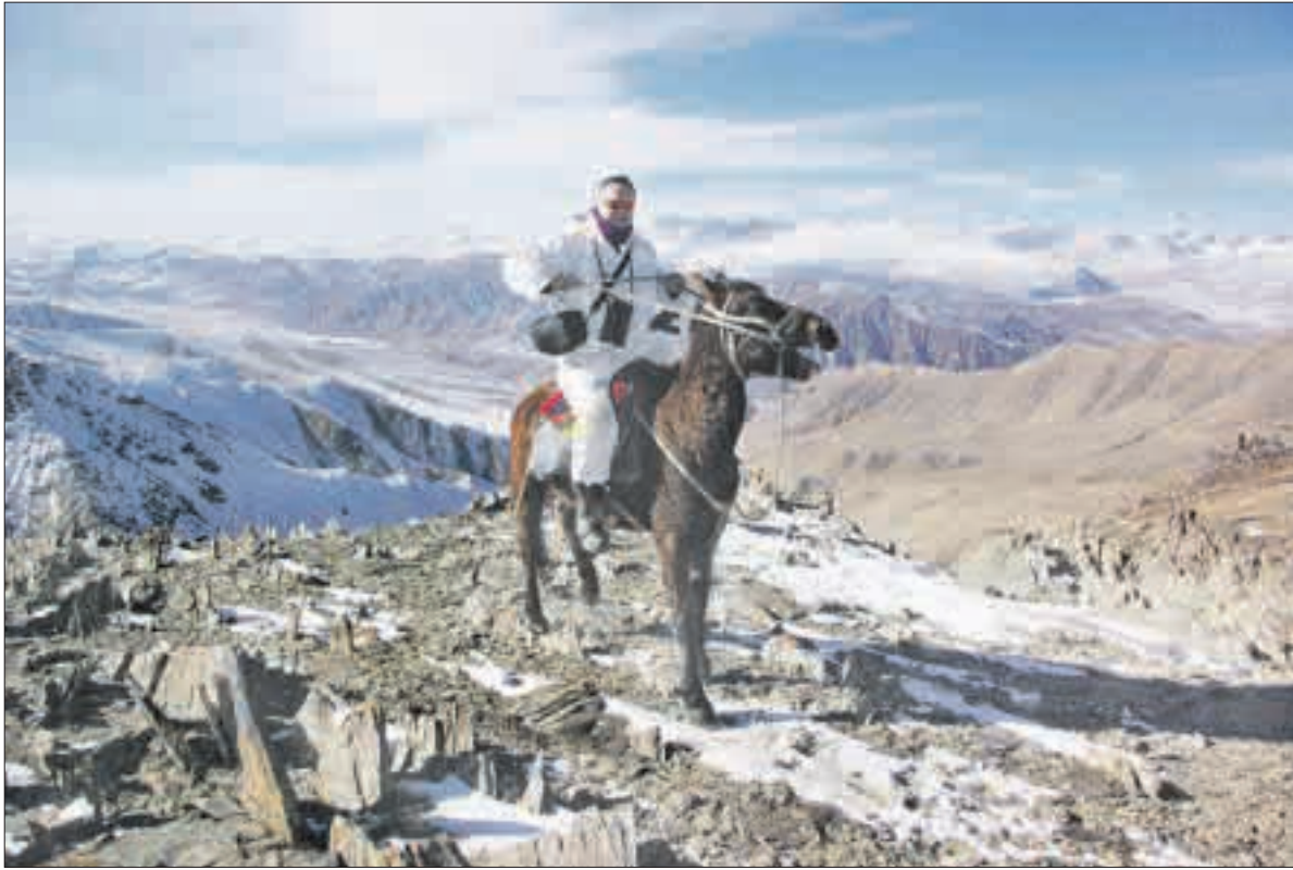
Kirgizijoje į pagalbą medžiotojams atedavo vietos arkliai...