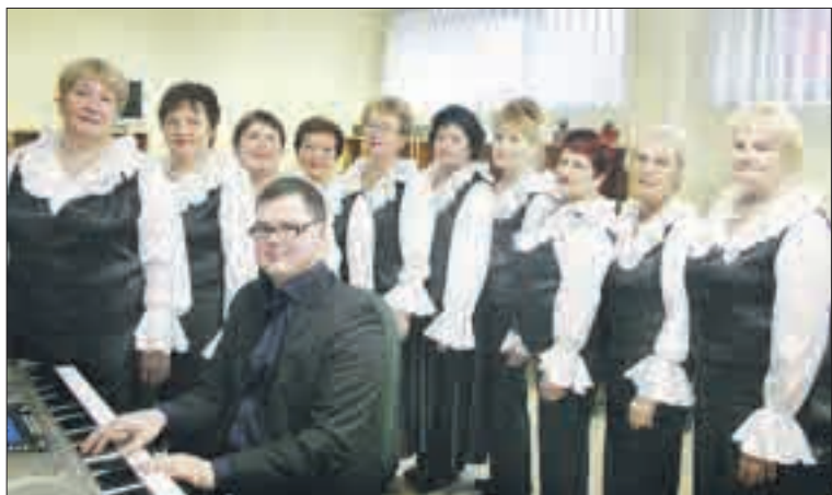
Į Gargždus „Indros“ ansamblis išvažiavo pakiliai nusiteikęs.

Kristina VARKALYTĖ